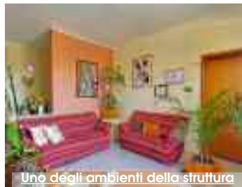
Uno degli ambienti della struttura